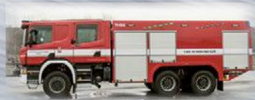
Takto by mohlo vypadat naše nové zásahové vozidlo např. Scania CAS 30 9000/540-S2R