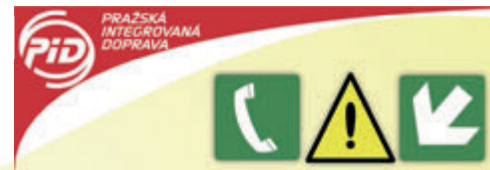
Tabulka cen jízdného z Mělnického Vtelna

Slevy jsou poskytovány především dětem a seniorům. Děti do 6 let jezdí zdarma, rovněž tak senioři nad 70 let (ti ale pouze v autobusech, ne ve vlacích). Děti od 6 do 15 let pak mohou cestovat za poloviční jízdné, pokud chtějí ještě vyšší slevu, budou potřebovat žákovský průkaz potvrzený školou pro konkrétní relaci mezi domovem a školou. To samé platí i pro žáky starší 15 let a mladší 26 let, kteří by jinak žádnou slevu neměli.